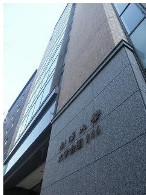
駒澤会事務局 (教育振興部)

7月10日(土) 役員会 上旬 駒澤会だより14号発行 22日(木) 駒澤会奨学金授与式 10月16日(土)～18日(月) 秋の研修会(永平寺・三国温泉) 30日(土) 役員会 11月27日(土) 駒澤会忘年会 12月 中旬 駒澤会だより15号発行