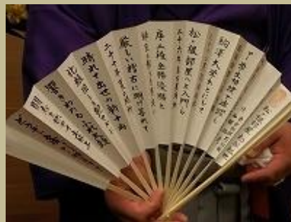
松谷関の経歴を織り込んだ 相撲甚句(すもうじんく)