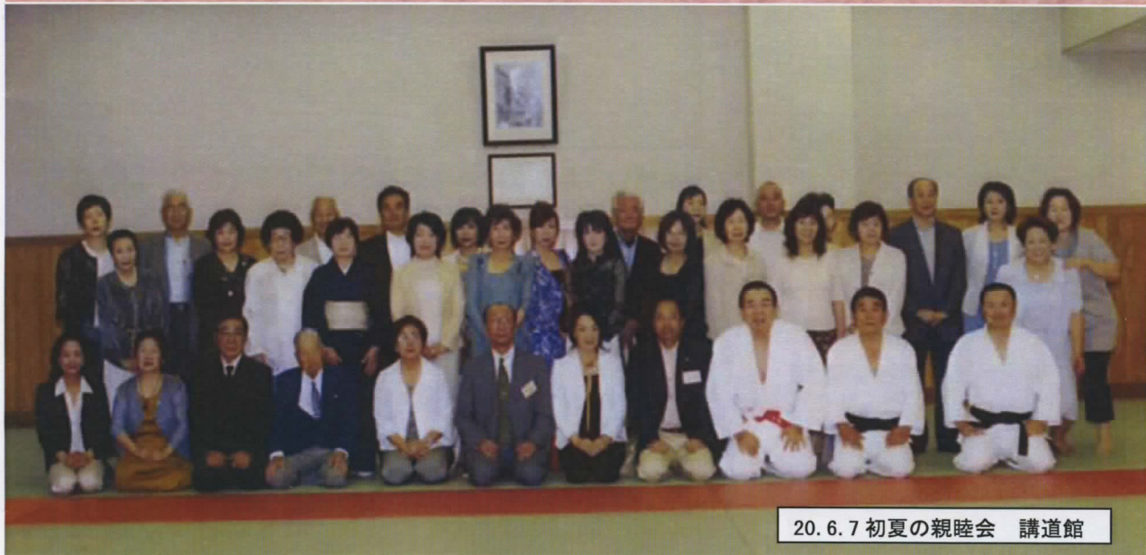
20.6.7 初夏の親睦会 講道館