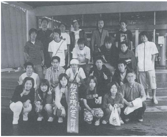
←夏のディベート合宿の写真です。山梨県鳴沢村でディベートとソフトボール大会に向け練習を行いました。ソフトボール大会では、清水ゼミ初の3位入賞となり、先生も大いに喜んでいらっしゃいました。ちなみにこの後みんなで温泉に行きました。

質疑応答を行っています。各国の文化の成り立ちには他国の侵略等により文化を融合・混成化されておらず、一つの文化で維持されていたわけではなく、このような点では日本と共通していることが分かりました。この調査を行うにつれドナウ河に関連する国々の情勢を知ることができ、ヨーロッパ経済を考えるうえで必要となる知識を学ぶことができました。合宿では春の新歓合宿と夏の