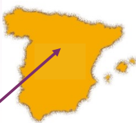
アルカラ・デ・エナーレス

また世界初の近代小説として知られる『ドンキホーテ』の作者セルバンテスの出生地としても知られています。