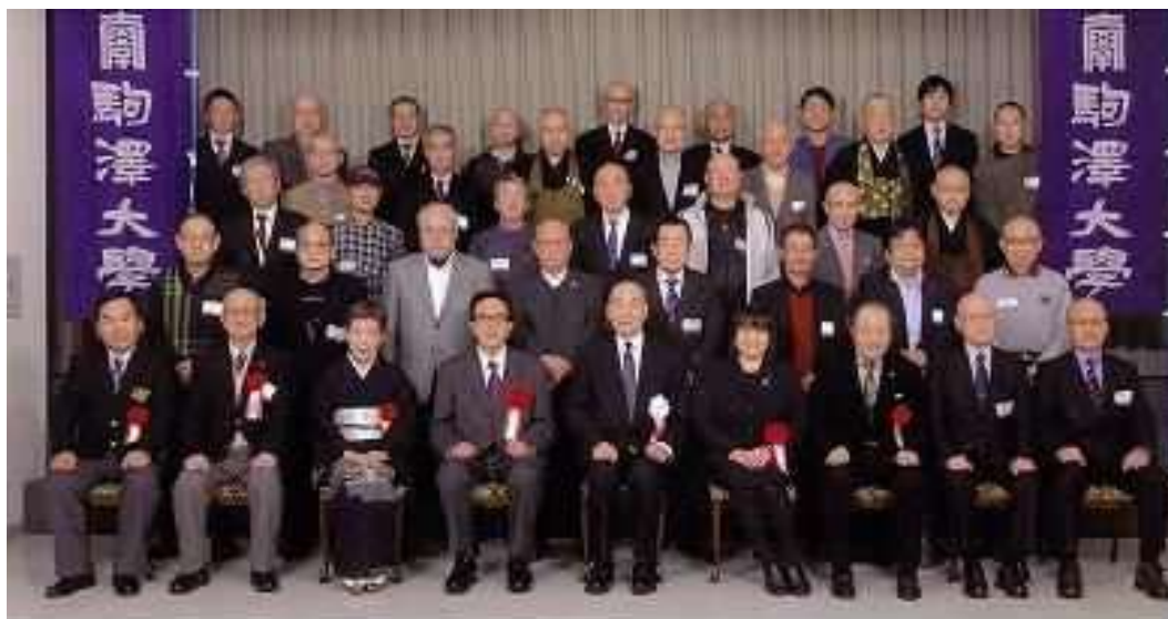
駒澤大学・駒澤短期大学同窓会 山口県支部 創立20周年記念大会 平成30年2月10日 於 山ログランドホテル