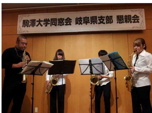
サキソフーンカルテット