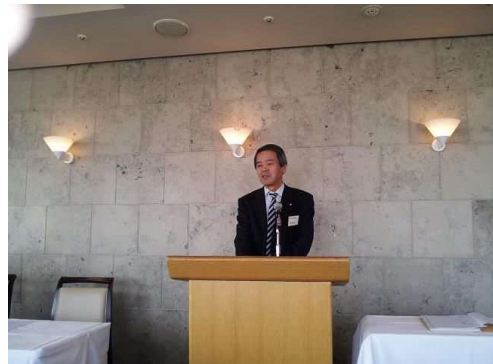
萩野副会長：近況報告